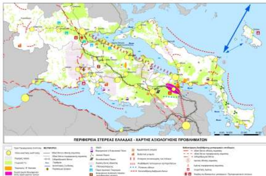
Χάρτης 1: Σύνοψη Ειδικού Πλαισίου Χωροταξικού Σχεδιασμού & Αειφόρου Ανάπτυξης –Περιφέρεια Στερεάς Ελλάδας

Με τα παραπάνω επιδιώκεται να παρασχεθεί, εκτός των άλλων, ένα σαφέστερο πλαίσιο στις αδειοδοτούσες αρχές και τις ενδιαφερόμενες επιχειρήσεις, ώστε να προσανατολιστούν σε καταρχήν κατάλληλες από χωροταξικής απόψεως περιοχές εγκατάστασης και να περιορίσουν έτσι τις αβεβαιότητες και τις συγκρούσεις χρήσεων γης που συχνά αναφέρονται επί του πεδίου.